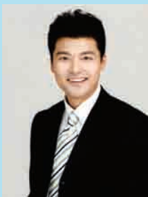
전현무 KBS 아나운서