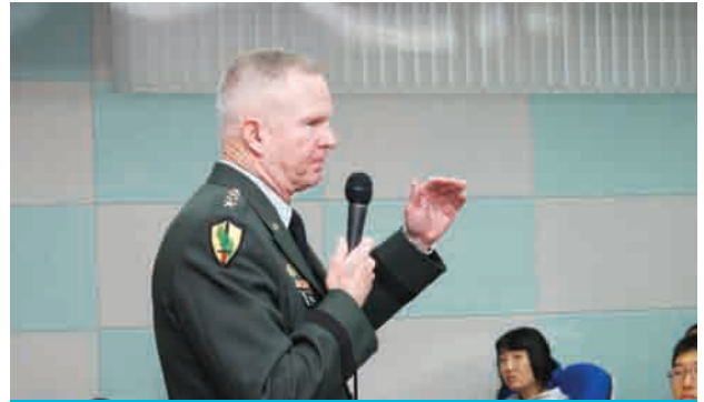
벨 전 한미연합사령관 초청 강연