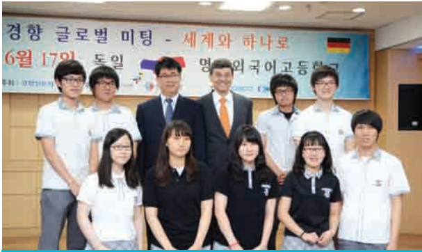
주한 독일대사 본교 방문