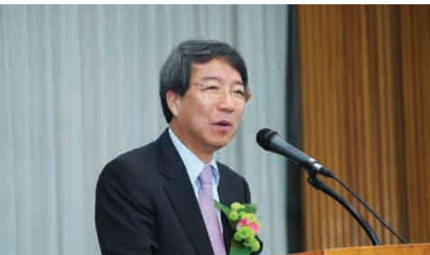
정운찬 박사 초청 강연